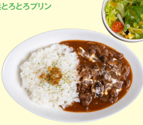
⑫湯梨浜ハヤシライス