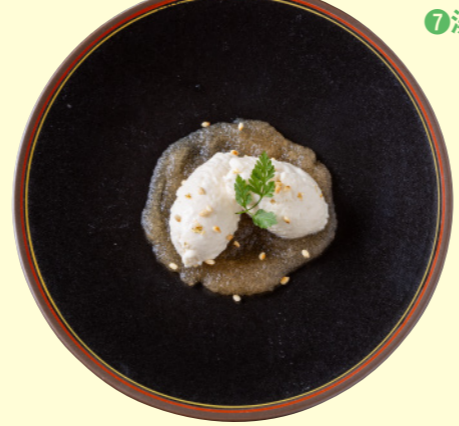
⑩星空舞ジェラート 野花梅酒のジュレ添え