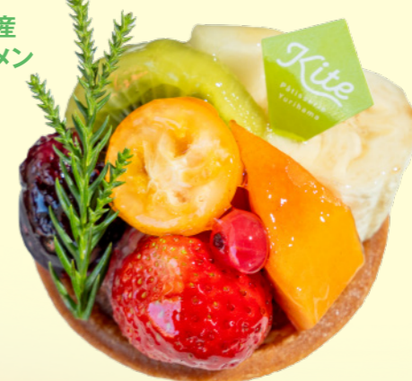
⑯湯梨浜フルーツタルト