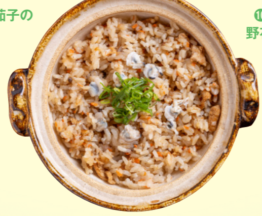
⑭東郷湖産鬼蜆の 炊き込みご飯