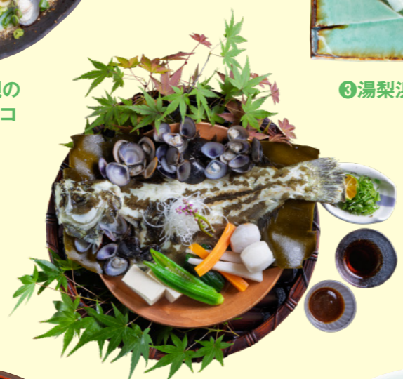
⑦湯梨浜ひらめと鬼蜆の 酒蒸し