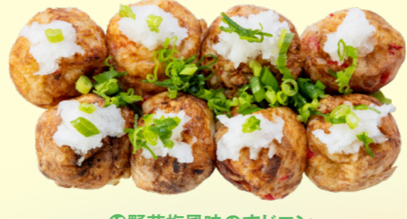
⑮野花梅風味のすじコン たこ焼き