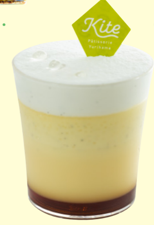
⑧湯梨浜とろとろプリン