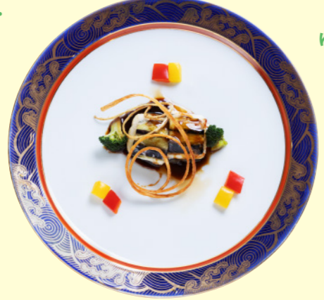
⑨湯梨浜ひらめと茄子の 網脂焼き