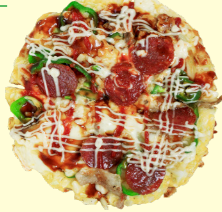
⑥お好み焼き ゆりはまイタリアン