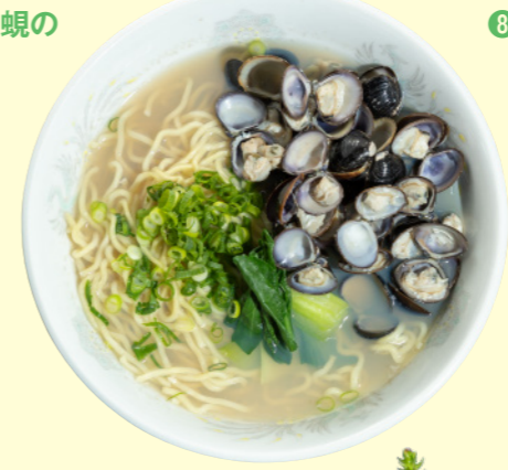
⑪東郷湖産 しじみラーメン