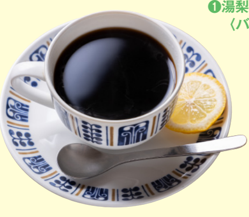
⑤カフェド・シトロン・ ゆりはま