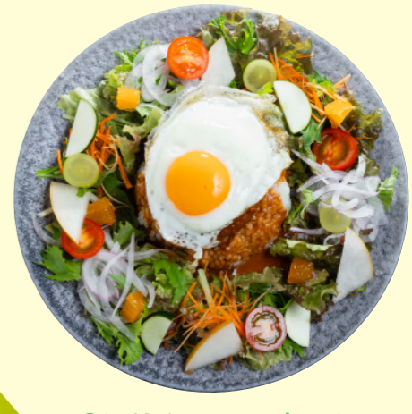
④湯梨浜ロコモプレート