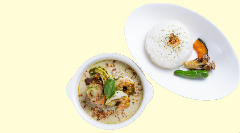
①湯梨浜グリーンカレー (バジル増しまし)