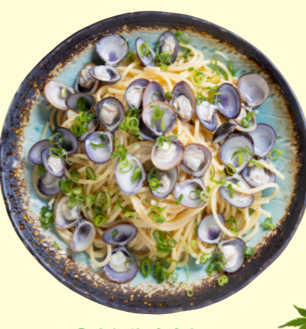
②東郷湖産鬼蜆の ボンゴレビアンコ