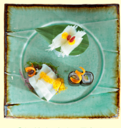
③湯梨浜ひらめの昆布バ・ 三種盛り