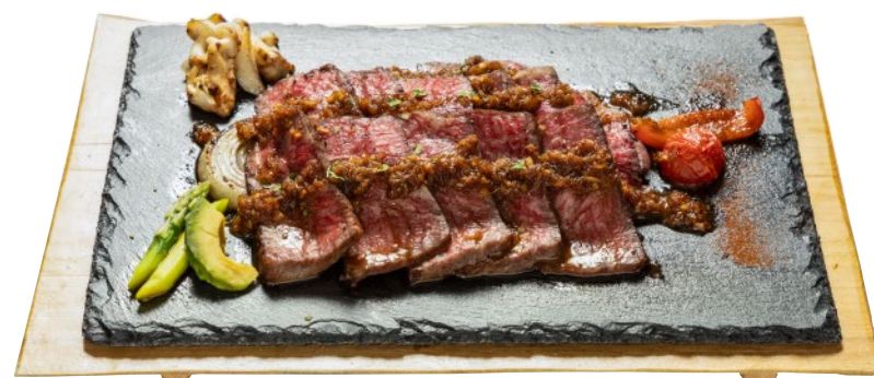
⑯和牛のBBQ 湯梨浜産梨のメキシカンソース