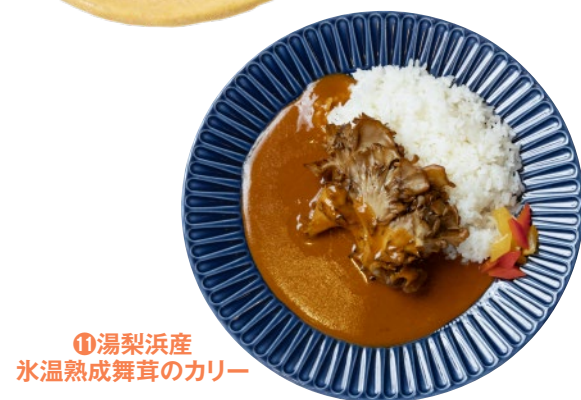
⑩湯梨浜産水溫熟成舞茸のカリー