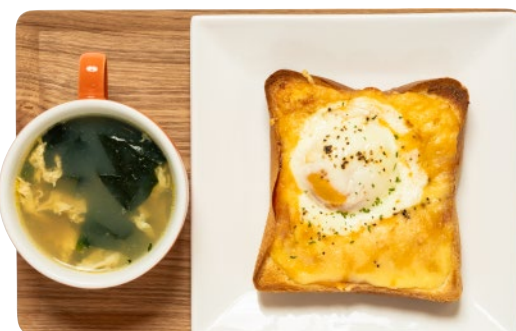
⑬湯梨浜産温泉たまごのクロックマダムと鬼蜆のスープのセット