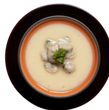
⑨鬼蜆と湯梨浜産たまごの玉締め