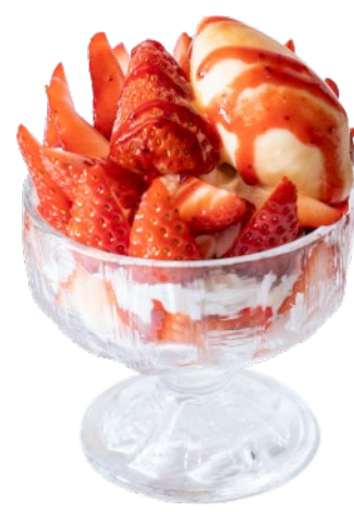
⑮湯梨浜産いちごの花びらパフェ