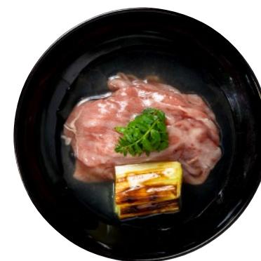
⑭東郷湖産蜆と鳥取和牛の吉野煮