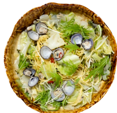
⑫東郷湖産鬼蜆のスープバゲティとブルスケッタ