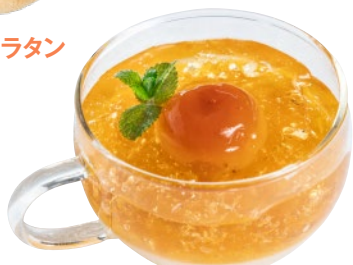
①湯梨浜産 野花梅のゆるスイーツ