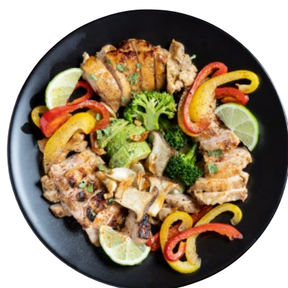
⑦湯梨浜生麹ジャークチキンプレート