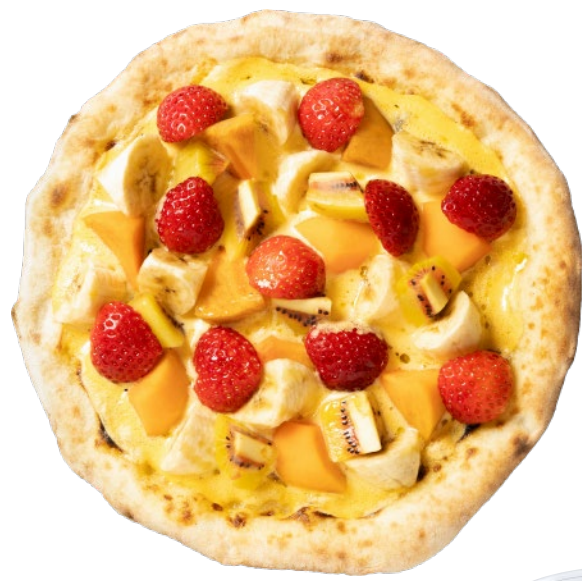
⑤湯梨浜産フルーツグラタンピッツァ