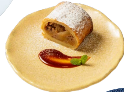
⑪湯梨浜フルーツパイ