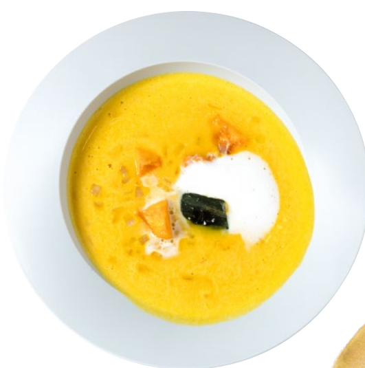
⑧湯梨浜産野菜の濃厚ポタージュセット