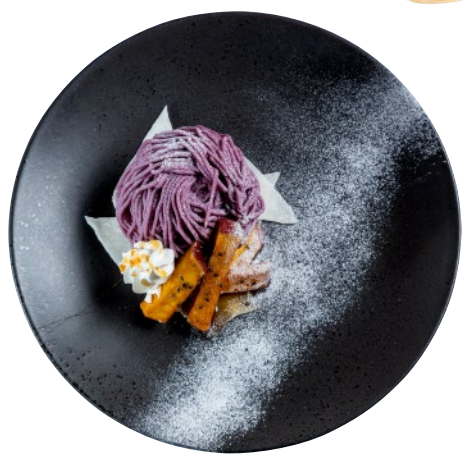
④湯梨浜おいもブラン