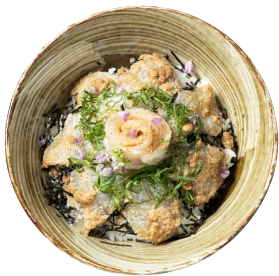
①湯梨浜ひらめの贅沢丼