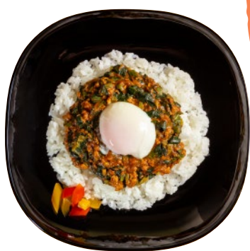
②湯梨浜産ほうれん草と鶏胸肉のドライカレー