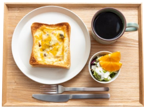
⑩湯梨浜産野菜のトマトグラタンパン